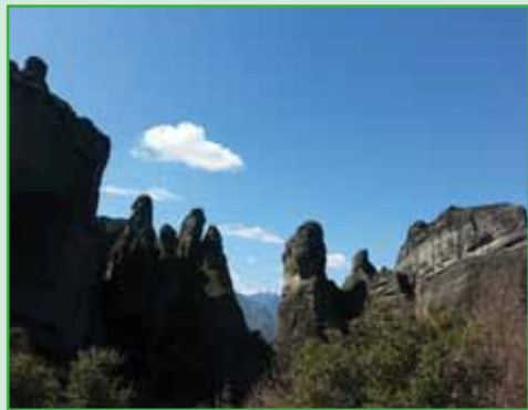
۳. رسوبات مخروطی شکل به صورت کوه‌ها

مته‌ئورا ۱ که به معنای «معلق در هوا» یا «صخره‌های معلق» است به «بهشت معلق» نیز معروف است. مته‌ئورا در مرکز یونان و در نزدیکی شهر کالامبکا ۲ قرار دارد. مته‌ئورا مکانی منحصر به فرد است که در سال ۱۹۸۸ در لیست میراث جهانی یونسکو به ثبت رسیده است. صومعه‌ها روی سنگ‌های طبیعی (ماسه‌سنگ) در قسمت شمال غربی دشت تسالی در نزدیکی رودخانه پینوس ۳ و کوه پیندوس ۴ ساخته شده‌اند. این سنگ‌ها به دلیل وجود دلتای مخروطی شکل در این محل، که از سنگ‌ها و گل و لای رودخانه که به دریاچه تسالی باستانی جریان یافته است، به وجود آمده‌اند. دلتاهای مخروطی که تحت عنوان دلتاهای دانه درشت نیز خوانده می‌شوند، رسوبات مخروطی شکلی هستند که مستقیماً از ناحیه منشأ به داخل دریا یا دریاچه ریخته شده‌اند. دلتاهای مخروطی اغلب در نزدیکی مناطق گسلی فعال جایی که کوه‌ها بالا آمده‌اند و خرده‌های فرسایش یافته و از طریق دره‌های عمیق مستقیماً به دریا و دریاچه وارد می‌شوند، تشکیل می‌شوند. (تصویر ۳)