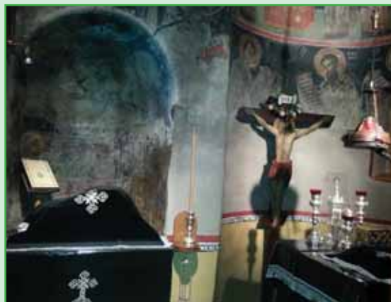
۱ و ۲ نمادهای فرهنگی در کلیساها

اکثریت مسیحیان یونان پیرو مذهب ارتودکس هستند که یکی از سرشاخه‌ها یا سرمذهب‌های اصلی مسیحیت است. مهم‌ترین مکان‌های مذهبی باستانی یونان عبارت‌اند از: مونت آتوس، مته‌ئورا و پاتموس.